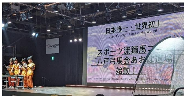
ステージ発表(学院紹介)の様子