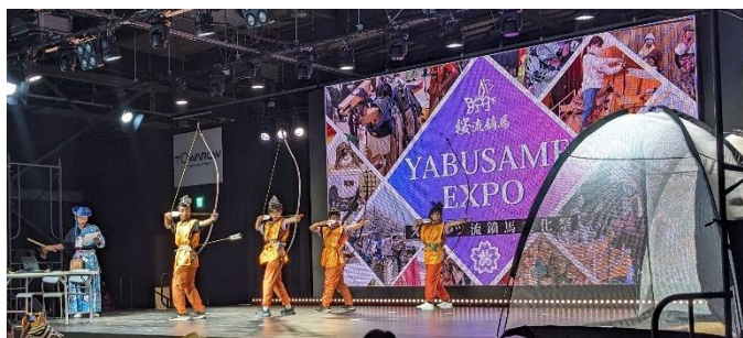
立射演武披露の様子