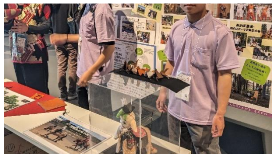
ブース展示の様子